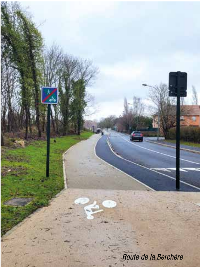
Route de la Berchère

La Communauté d'Agglomération Plaine Vallée a réalisé des travaux de renforcement de structure et de réfection totale du revêtement de la chaussée dans le carrefour rue Charles de Gaulle, rue du Président Paul Doumer et rue Philippe le Bel. Ces travaux ont aussi permis d'améliorer l'accessibilité du cheminement dans ce carrefour et de revoir la conformité des passages piétons. Ces aménagements ont été réalisés par l'entreprise Filloux en lien avec la commune.