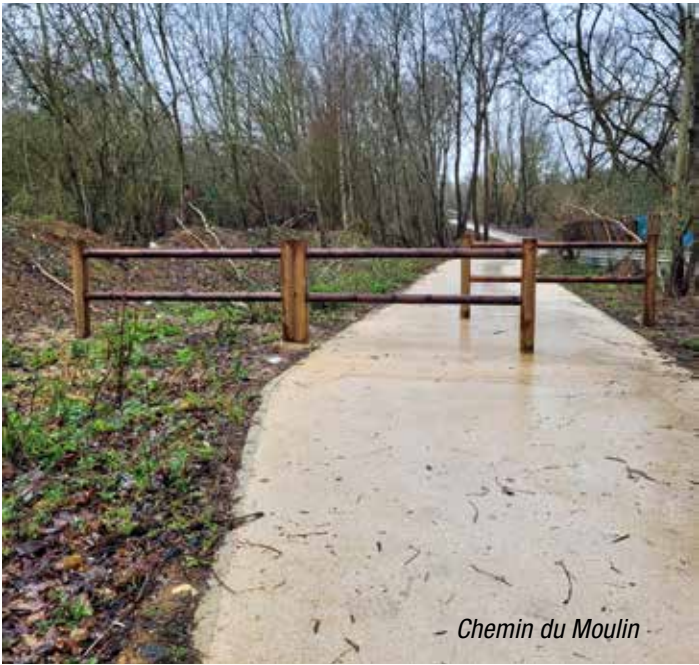
Chemin du Moulin